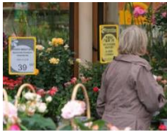
Commerce de proximité.jpg

Banque d'images : cliquez pour y accéder