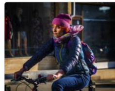
se déplacer à vélo