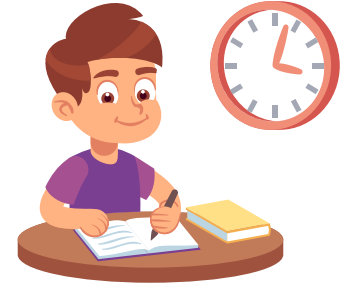
Faire ses devoirs