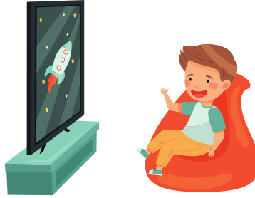
Regarder la télévision