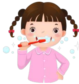
Se brosser les dents