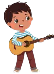
Jouer de la musique