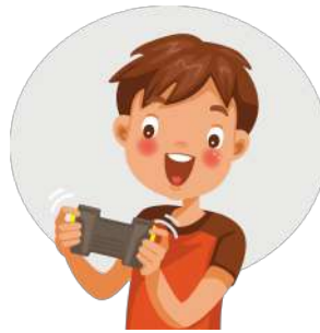
Jouer à un jeu vidéo