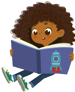
Lire un livre